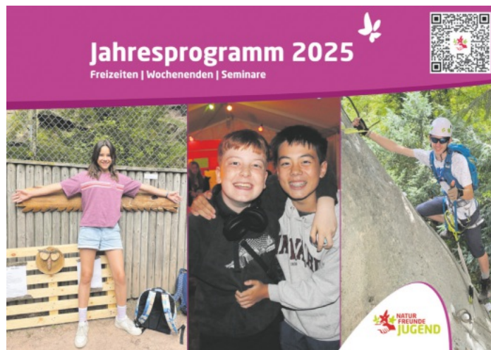
Das Jahresprogramm 2025 der Naturfreundejugend Baden

Das komplette Jahresprogramm und die entsprechenden Anmeldeformulare gibt es online unter www.naturfreundejugend-baden.de .