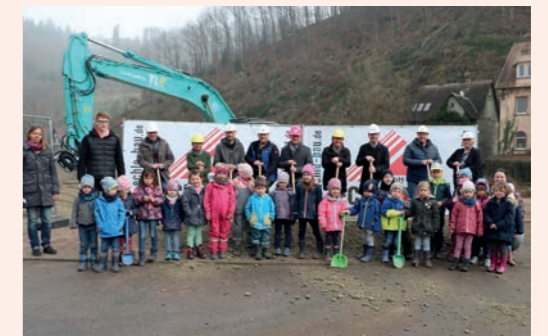
Spatenstich für den Kindergartenneubau