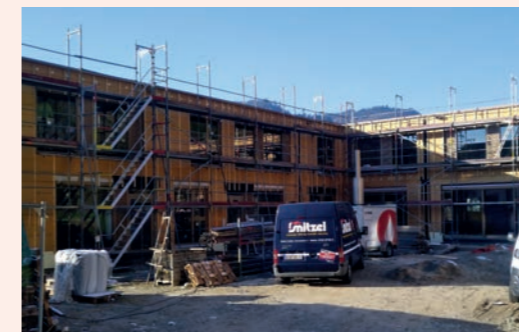
Beginn des Innenausbaus