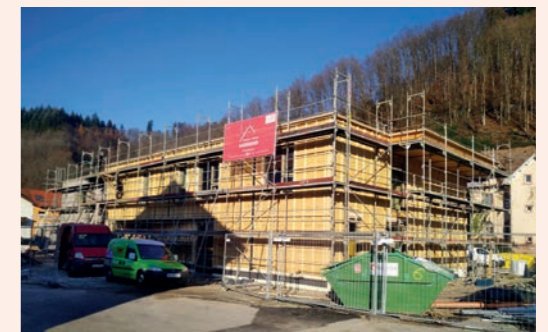
Bodenbelagsarbeiten, Fliesenarbeiten, Malerarbeiten, Fassadenarbeiten, Deckenarbeiten