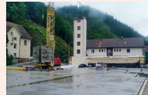
Übergabe der Bodenplatte an den Zimmermann