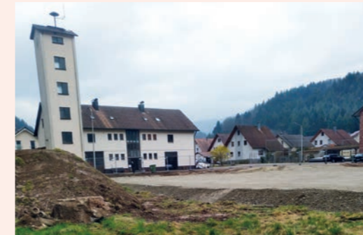
Beginn der Tiefbau- und Gründungsarbeiten