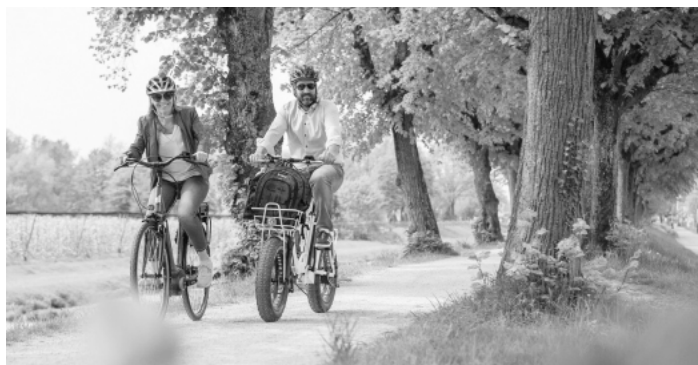
Genussradeln im Renchtal

Der Preis pro Person beträgt 55,- EUR und beinhaltet die 6 Genuss-Stationen inklusive regionalen Spezialitäten und Getränken. Anmeldungen für das Renchtäler Genussradeln am 17. September werden von der Renchtal Tourismus GmbH unter der Telefonnummer 07802 82600 oder per Mail info@renchtal-tourismus.de entgegengenommen.