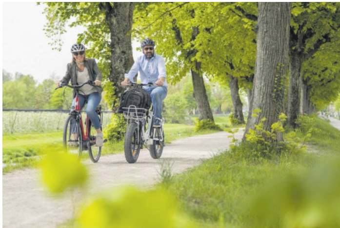
Renchtäler Genussradeln

Der entsprechende Flyer steht unter folgendem Link zum Download zur Verfügung: www.renchtal-tourismus.de . Eine Anmeldung ist bei der Renchtal Tourismus GmbH, Tel. 07802 82600 oder info@renchtal-tourismus.de erforderlich.