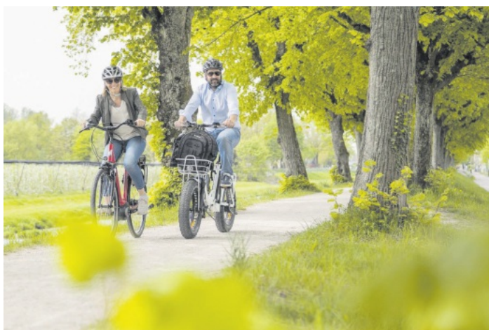
Renchtäler Genussradeln

Die entsprechenden Flyer stehen unter folgendem Link zum Download zur Verfügung: www.renchtal-tourismus.de . Eine Anmeldung für alle Veranstaltungen ist bei der Renchtal Tourismus GmbH, Tel. 07804 4836 oder oppenau@renchtal-tourismus.de erforderlich.