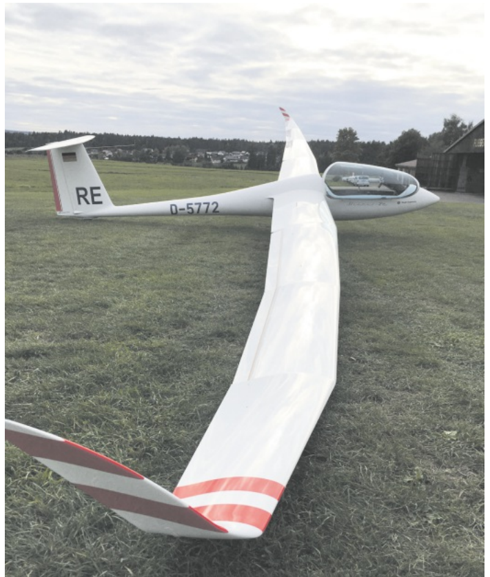
Neuer Segler DISCUS 2C getauft auf STADT OPPENAU

Zusätzliche Infos sind zu finden auf www.fliegergruppe-renchtal.de