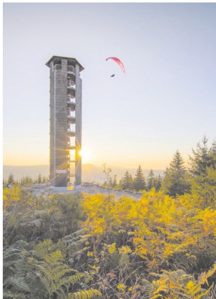
Renchtäler Herbstwochen

Alle weiteren Informationen finden Sie in der DORT-Broschüre und auf der Tourismuswebsite unter www.ortenaus-tourismus.de .