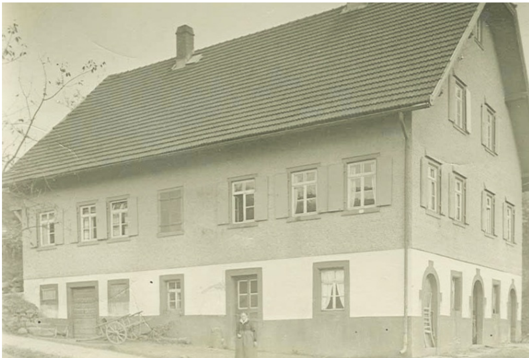
Beim „Bohnensepp“ am Farnweg um 1930