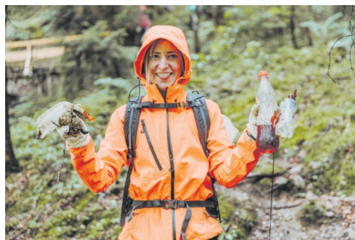
Clean Up Days

In einer weiteren freien Sonderführung speziell für Familien um 11 Uhr mit dem Titel „Für Sprösslinge“ können die jüngsten Museumsgäste mit Kräuterpädagogin Walburga Schillinger die ersten Frühlingskräuter und Blüten entdecken. Wie diese auf einem Brot mit frisch geschlagener Butter schmecken, kann im Anschluss probiert werden. Die Teilnehmerzahl ist beschränkt. Hier wird um Voranmeldung unter Telefon 07831 4679 3500 oder per E-Mail an info@vogtsbauernhof.de gebeten.