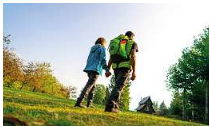
Lautenbacher Hexensteig

Im Laufe von mehr als 50 Tagen werden ab dem 14. Januar täglich um 9:30 Uhr und um 16:00 Uhr zwei frisch zertifizierte Wege auf dem Facebook Kanal von „Wanderbares Deutschland“ online portraitiert. Neben diesen Portraits gibt es eine Bilderschau der ausgezeichneten Wege auf dem YouTube Kanal des Deutschen Wanderverbands. Außerdem sind die Wege mit ausführlichen Informationen auf www.wanderbares-deutschland.de zu finden. Die digitale Veranstaltung war nötig geworden, nachdem die ursprünglich für die Auszeichnung geplante Tochtermesse der CMT, die Fahrrad- & Wanderreisen, vom 15. bis 17. Januar in Stuttgart corona-bedingt abgesagt worden war. Die Online-Zertifizierung für den Lautenbacher Hexensteig findet am 20.02.2022 um 16:00 Uhr und für den Oberkircher Brennersteig am 21.02.2022 um 9:30 Uhr statt.