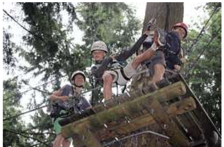
Naturfreundejugend Baden in Aktion!

Das vollständige Jahresprogramm und die jeweiligen Anmeldeformulare gibt es online unter www.naturfreundejugend-baden.de .