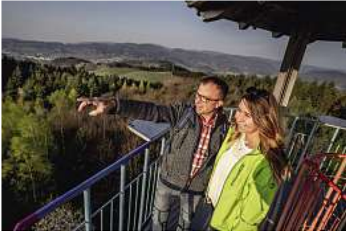
Geigerskopfturm am Oberkircher Brennersteig