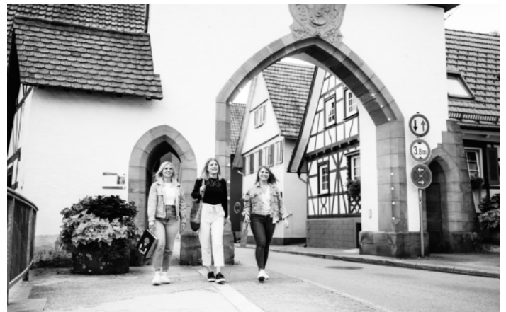
Ein Tag in Oppenau.

Die Renchtal Tourismus GmbH hat hierzu einen neuen Flyer aufgelegt. Dieser ist in den Servicestellen der Renchtal Tourismus GmbH sowie online unter www.renchtal-tourismus.de verfügbar.