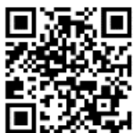
QR-Code AbfallApp Ortenaukreis

Bei Fragen zu den Abfallgebühren oder zum Kundenportal unterstützt das Gebührenteam des Eigenbetriebs Abfallwirtschaft unter Tel. 0781 805-6000 oder per E-Mail abfallgebuehren@ortenaukreis.de .