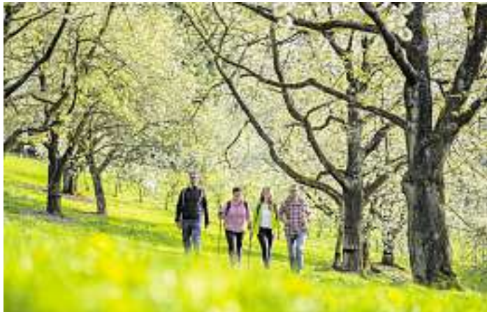
Unterwegs auf dem Oberkircher Brennersteig

Programmanpassungen sind aufgrund der aktuellen Lage möglich. Bitte informieren Sie sich vor Besuch einer Veranstaltung über die aktuell geltenden Corona-Regeln. Den Flyer „Renchtaler Frühlingswochen“ mit den Veranstaltungen finden Sie in allen Servicestellen der Renchtal Tourismus GmbH sowie online unter www.renchtal-tourismus.de